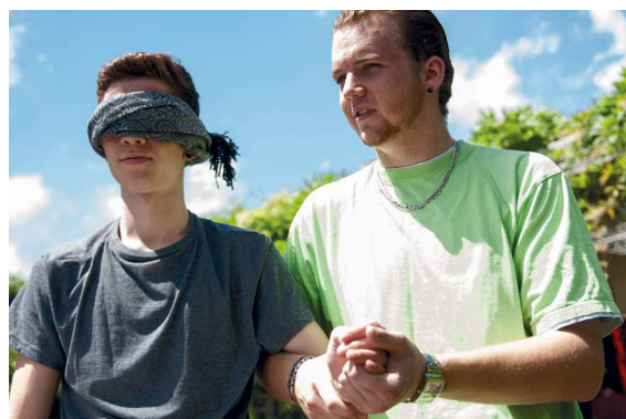
Sich aufeinander einlassen