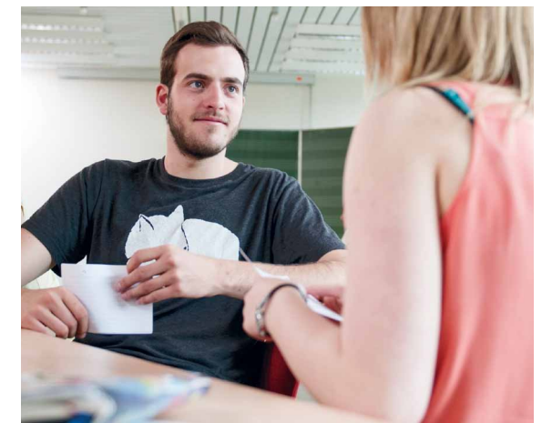
In Übungsaufgaben gelerntes Wissen verfestigen

Durch die Ausbildung wird die Fachhochschulreife für Rheinland-Pfalz erreicht, wenn das Modul „Berufsbezogene Kommunikation in einer Fremdsprache“ mit mindestens ausreichend abgeschlossen wird.